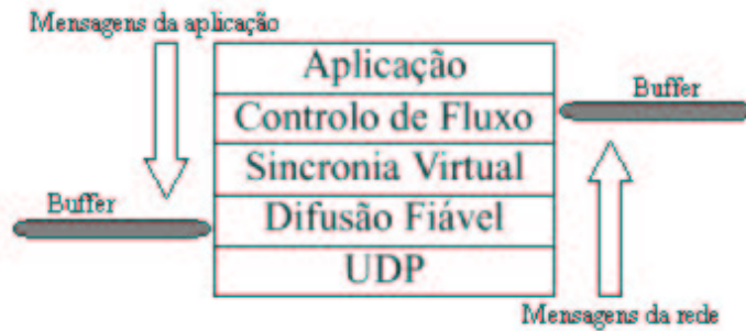
Figura 2: Fluxo de eventos (ou mensagens) dentro de um processo.

de ser configurado de forma diferente em relação aos receptores. Depois de testes efectuados com a pilha existente, verifica-se que a quantidade de memória necessária para um emissor é 35% maior do que para um receptor. É importante tomar em conta este pormenor no momento da configuração de cada elemento para que todo o sistema funcione com eficiência.